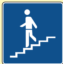
Podzemni ili nadzemni pješački prolaz