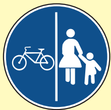
Razdvojena staza za pješake i bicikliste

Pješak se u pravilu ne smije kretati i zadržavati na kolniku. Ako se pješak kreće kolnikom, on se mora kretati što bliže ivici kolnika i to veoma pažljivo i na način kojim se ne ometa ili ne sprječava promet vozila. Novčanom kaznom u iznosu od 40,00 KM kaznit će se za prekršaj: pješak koji se nepotrebno zadržava na kolniku na način kojim se ometa ili sprječava promet vozila.