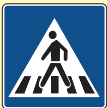
Obilježeni pješački prijelaz