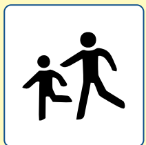
Djeca na cesti