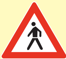
Pješaci na cesti