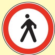
Zabrana prometa za pješake